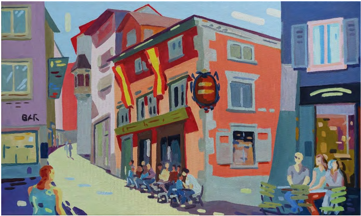
Heiner Fierz: Bodega, Münsterergasse, Zürich / Öl auf Leinwand, 60 x100 cm, 2019